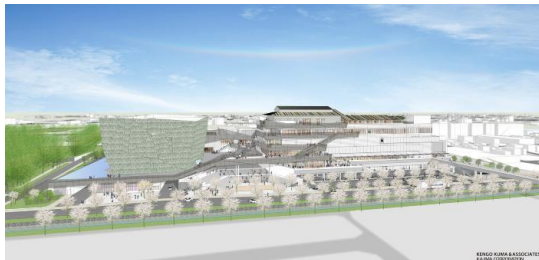
ところざわサクラタウン完成予定図（2018年2月時点） （一般質問の要旨）