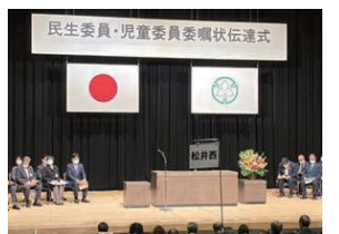
12/10 民生委員 退任式／伝達式