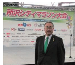
↑ 12/4 所沢マラソン 開会式+応援